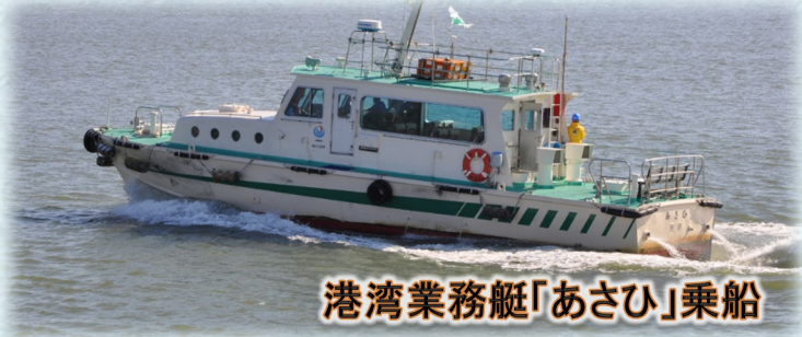
港湾業務艇「あさひ」乗船

主催 北陸地方整備局 新潟港湾・空港整備事務所、新潟港湾空港技術調査事務所、新潟市歴史博物館みなとぴあ