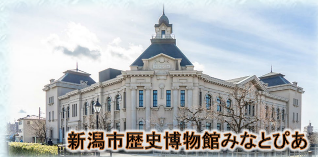
新潟市歴史博物館みなとぴあ