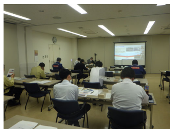
〈新潟港会場の様子〉