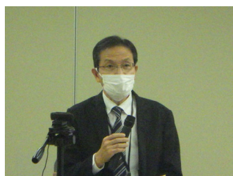
〈田邊事務所所長の開会挨拶〉